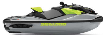
● NUEVO Ice Metal and Manta Green