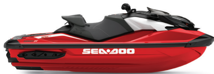
● NUEVO Fiery Red Premium