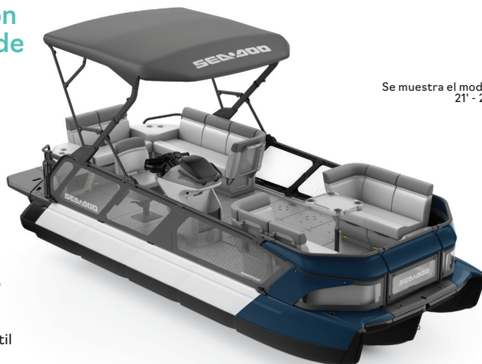
Se muestra el modelo 21' - 230